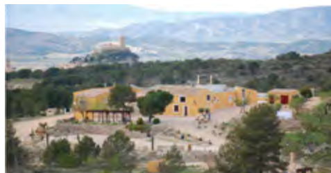
Las Lomas de Biar (Alicante)