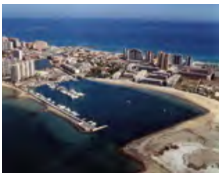
Zona Playa de Puerto Bello (La Manga del Mar Menor)